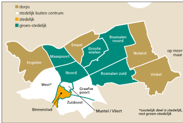
Figuur uit de woonvisie van de gemeente Den Bosch (2020)